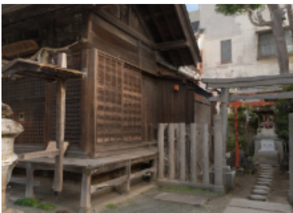
時の鐘の下をくぐると薬師神社。病気平癒のご利益がある。隣には稲荷神社がまつられている。