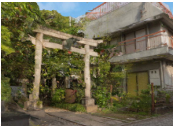
雷塚稲荷神社。商売繁盛のご利益がある。町内だけでなく、近隣の人々の信仰にも支えられてきた。