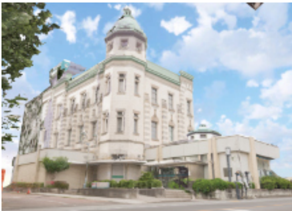
旧八十五銀行本店。明治期に埼玉県で初めて設立された、唯一の国立銀行。埼玉りそな銀行の前身。